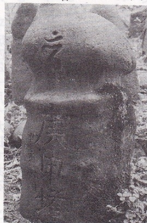
①蓮照院址の庚申塔

◎高速船は予約制です。前もってご予約下さい。 ◎島内へは車は持ち込むことは出来ません。岩船港無料駐車場を御利用下さい。